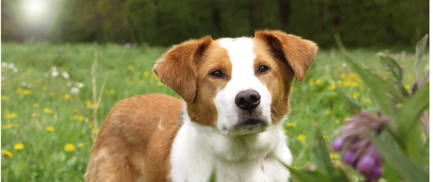
Foto: Sharko, de hond waarmee het begon...