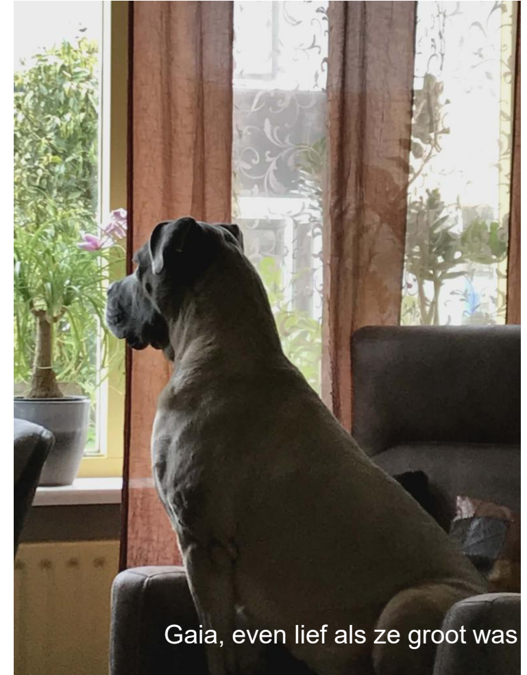
Gaia, even lief als ze groot was

Nu is 't goed gekomen met Gaia (er was zelfs een tweede operatie nodig), maar dit incident is mij altijd bijgebleven, want hoeveel mensen zoeken meteen hulp?